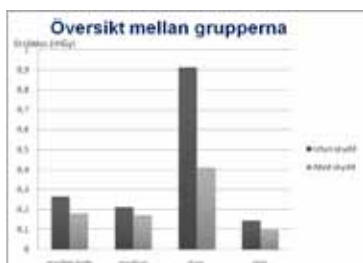
Figur 4. Stråldosen till testiklarna vid användning av gonadskydd visar en stråldosreduktion med 31,8%